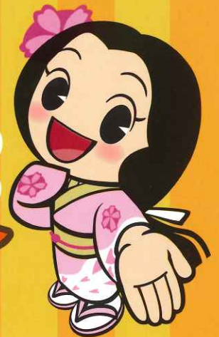
さんがわにちゃん